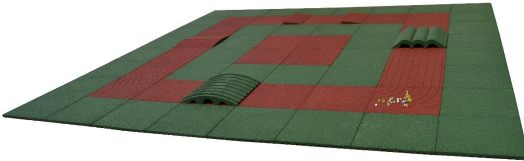
INTERMEDIARIO 16 m 2 (4 x 4 m)