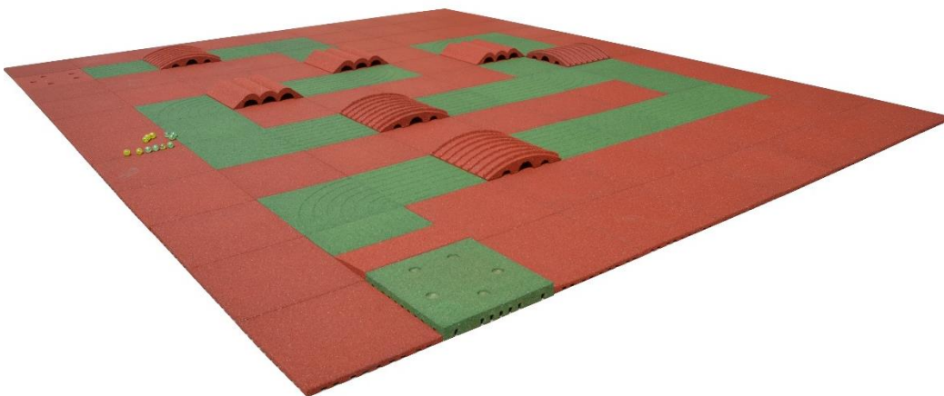
PREMIUM 24.75 m 2 (4.5 x 5.5 m)

Los modelos, dibujos y nombres de este documento están registrados. Por lo tanto, queda prohibido copiar o reproducir el contenido de este documento sin acuerdo escrito de antemano.