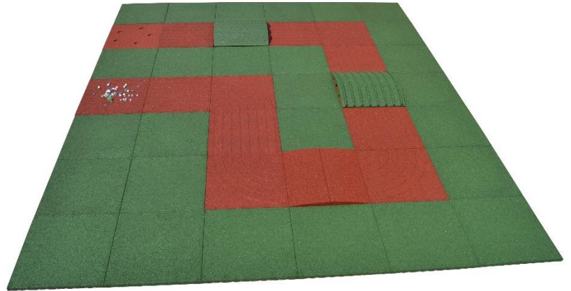
BÁSICO 10.5 m 2 (3 x 3.5 m)